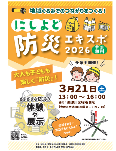
主催者作成のチラシ